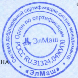
схема сертификации - 1с